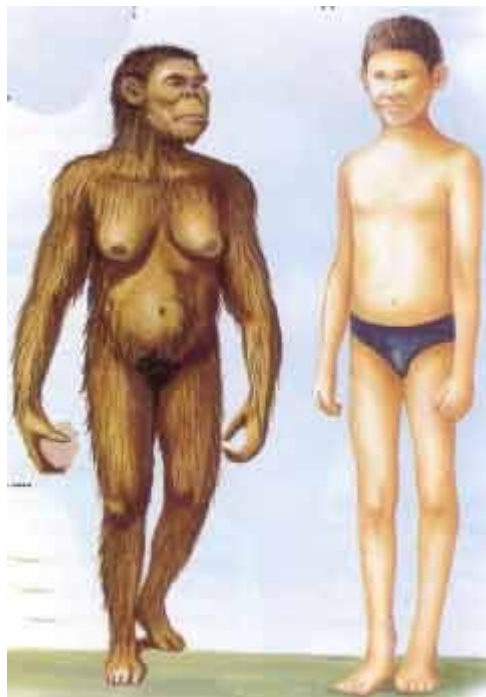
L'australopithèque Lucy et un élève de 11 ans